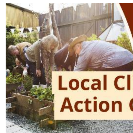
Local Climate Action Group